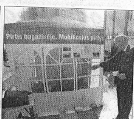
Parodos dalyviai galėjo išbandyti surenkamą pirtį