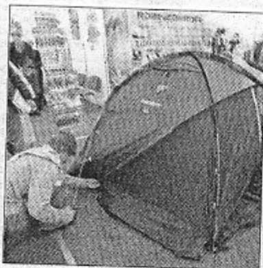
Parodoje netrūko įvairaus inventorius, skirto turizmui