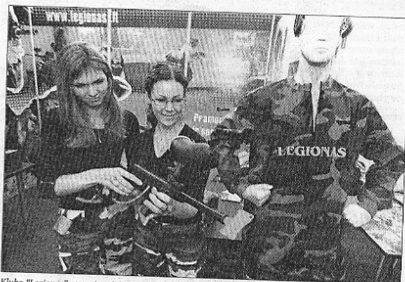
Klubo "Legionas" atstovų teigimu, dažšvydis - puikiausias laisvalaikio leidimo būdas

Kaune surengta pirmoji specializuota paroda "Aktyvus laisvalaikis"