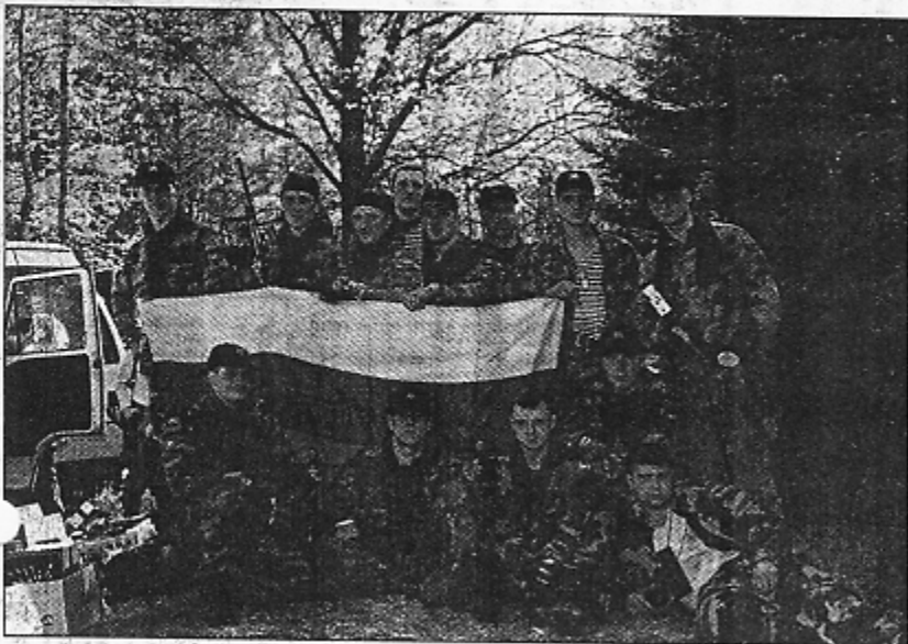
Klubo "Legionas" komanda pamokė naujuosius rusus

Pamaskvėje vykusiame dažasvydžio varžybose "Didieji manevrai" dalyvavo rusai, latviai, baltarusiai ir lietuviai