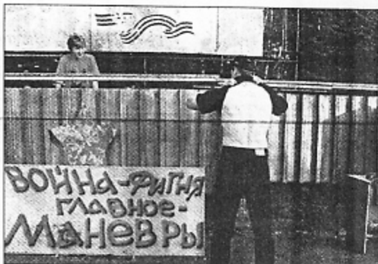
Karas - niekalas, svarbiausia - manevrai

Kol kalbame lietuviškai, tol ir dainuokime lietuviškai!