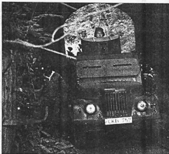
"Legiono" klubo nariai patys susikonstravo "tentą", su kuriuo važiuoja pulti priešų stovyklas