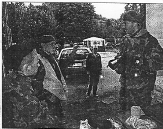
Prieš kovą vyrai aptaria "mūšio" strategiją