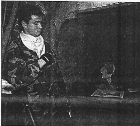
Generolas visuomet privalo vadovauti komandos veiksmams, kurti mūšio strategiją