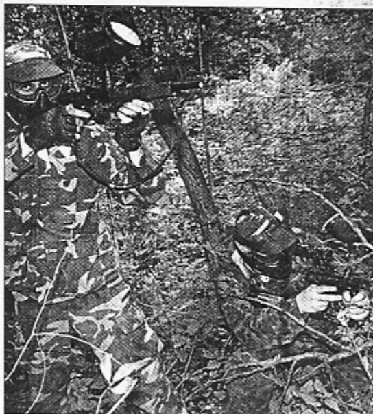
Visuomet reikia likti budriems bei šautuvą laikyti pakelta, nes bet kada gali iškilti būtinybė jį panaudoti

Jis pridūrė, jog kiekvienas žaidėjas privalo tiksliai, greitai ir sumaniai vykdyti generolo įsakymus. Be to, turi būti susipažinęs su įvairiomis šio sportinio žaidimo