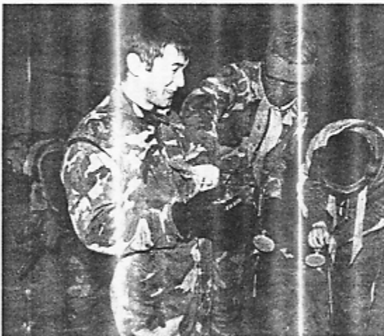
Čekėnų moksleiviai rengiasi mūšui