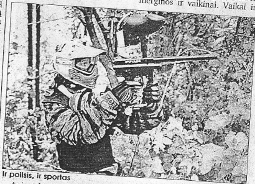
Ir poilsis, ir sportas

Kiekvienas suaugęs žmogus žino, kad paauglių laisvalaikis turi būti turiningas. Daug laiko mūsų vaikai praleidžia mokyklo- je. Jie mokosi, lanko būrelius, dalyvauja įstaigos organizuoja- muose renginiuose, olimpiado- se, viktorinose, konkursuose. Bet popamokine veikla dažniausiai užsiima aktyviausi ir protingiau- si mokiniai. O ką veikia kiti, ku- riems neįdomus aktyvusis mo- kyklos gyvenimas?